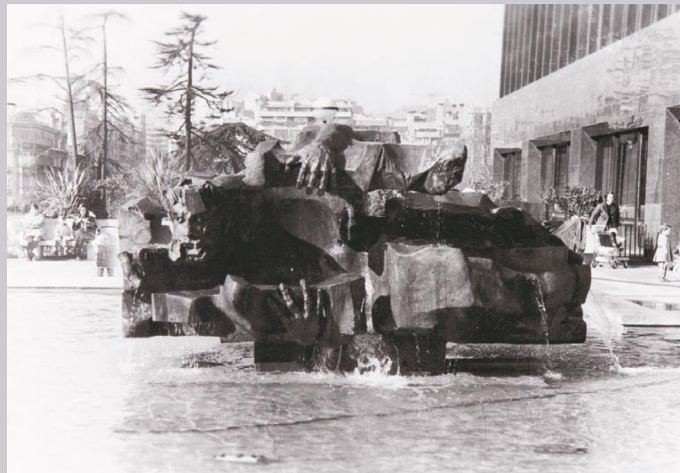
Homenaje a la fuente y el río. 1971-1972. Bronce, Calle Serrano, Madrid.